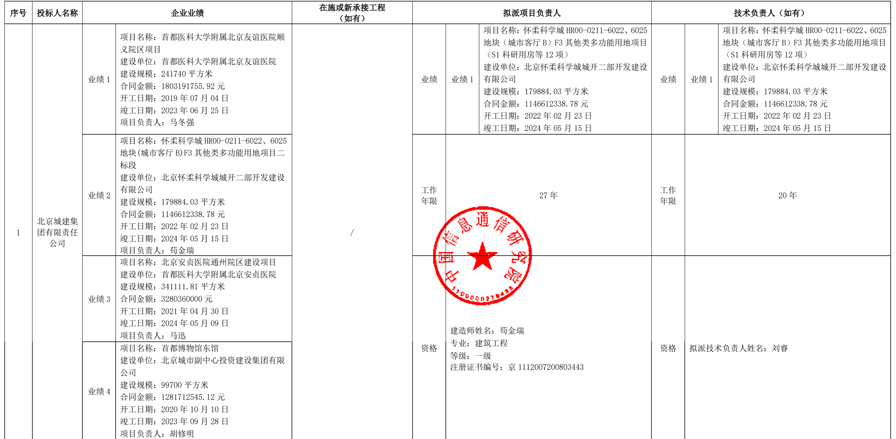
合格投标人商务信息公示表